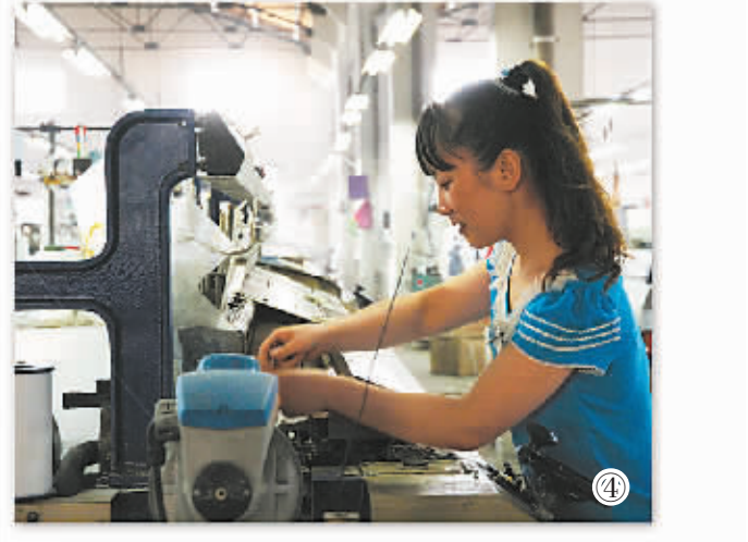
图④:纺织业仍是开弦弓村的传统产业,只是老旧的设备如今已换成喷水织机,产业效益大大提高。