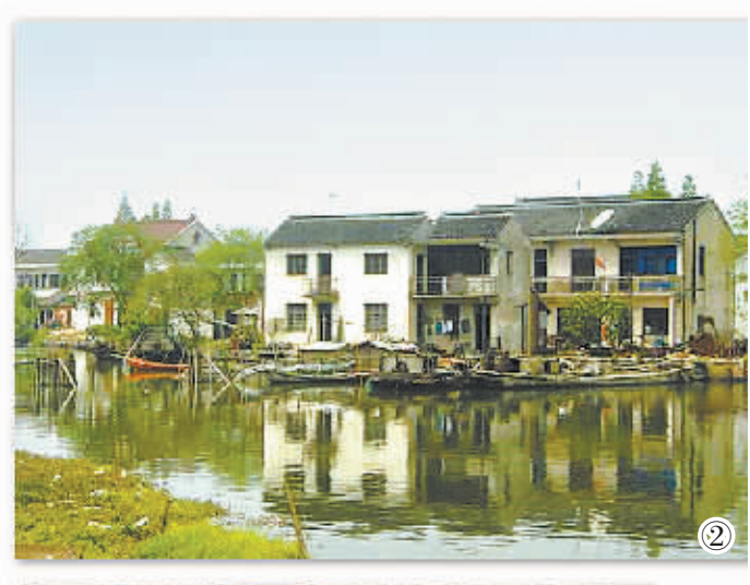
图②:1995年开弦弓村沿河民居。